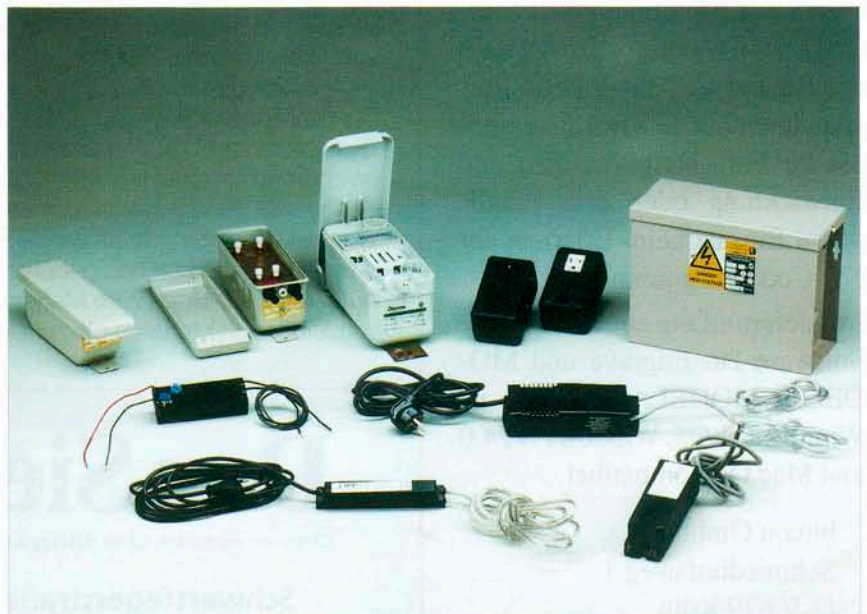
Transformatoren höchster Qualität: Neben den hauseigenen elektronischen Vorschaltgeräten vertriebt American Neons Transformatoren der Firmen »Tunewell« und »Diemme« in Deutschland exklusiv