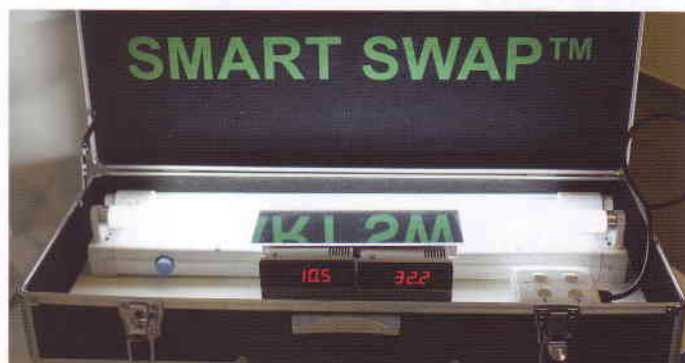
Um die Leistungsaufnahme der unterschiedlichen Leuchtstoffröhren zu vergleichen, wurde ein System zur Messung konstruiert.