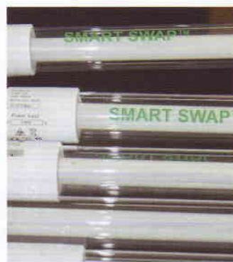
Bis zu 70% Energieersparnis bei gleichzeitig höherer Lichtausbeute verspricht die neuartige Leuchtstoffröhre Smart Swap.

»Manche Dinge werden einfach als gegeben hingenommen – weil man es nicht besser weiß. Man betreibt Leuchtstoffröhren und denkt, sie