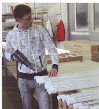
Die Energiespar-Röhre wird in Münster endgefertigt.