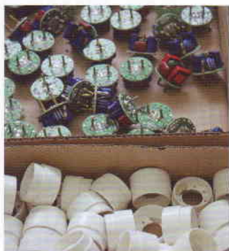
Die Smart Swap besitzt eine eigene, integrierte Vorschaltel Elektronik.